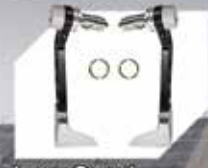
Lever Guard Rp. 335.000