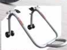
Racing Stand Rp. 420.000