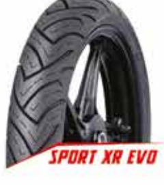
SPORT XR EVO

04 November: MotoGP seri 18 - Sepang Malaysia 18 November: MotoGP seri 19 - Ricardo Tormo Valencia 20 November: Maulid Nabi Muhammad SAW