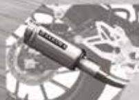
SAKURA GP Rp. 2.100.000