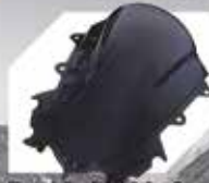
Double Bubble Screen Rp. 400.000