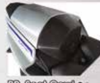
RR. Seat Cow Rp. 585.000