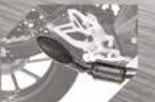
SAKURA SLASH TAIL Rp. 2.500.000