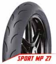
SPORT MP 27

01 Juli: MotoGP seri 8 - Assen Belanda 15 Juli: MotoGP seri 9 - Sachsenring Jerman