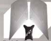
Tank Pad Rp. 270.000