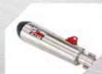
DAYTONA GP TAPER SLASH Rp. 1.650.000