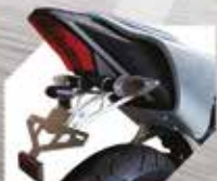
Short Rear Fender Rp. 530.000