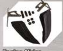
Engine Slider Rp. 440.000