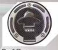
Fuel Cap Rp. 100.000