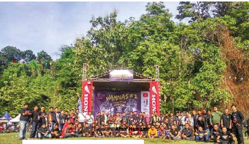
Laporan: Amir Hamzah

Jambore Nasional (JAMNAS) #2 Honda Mega Pro Club (HMPC) Indonesia berlangsung meriah di Wana Wisata Penggaron, Ungaran, Kab. Semarang pada 21 – 22 Oktober 2017, mengusung tema “Stay Young, Wild and Free” acara ini sukses di hadiri ribuan pengguna Mega Pro. Laporan: Amir Hamzah