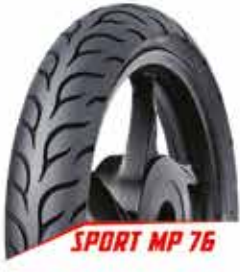
SPORT MP 76

05 Agustus: MotoGP seri 10 - Brno Rep. Ceko 12 Agustus: MotoGP seri 11 - Spielberg Austria 17 Agustus: Proklamasi Kemerdekaan RI 23 Agustus: Hari Raya Idul Adha 170 Dzulhijah 1439 H 26 Agustus: MotoGP seri 12 - Inggris