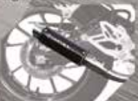
SAKURA CARBON Rp. 2.600.000