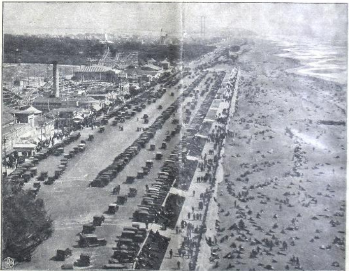
ပုံနှိပ်စရိတ် စာအုပ်အစားအကုန် စရိတ် စာအုပ် အစားအကုန် စရိတ် San Francisco. စာအုပ်အစားအကုန်